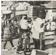
Grupo mudando pa casertinan nobo di Elizabethville

E panfleta ta acusa Krutscchef fuerzamente di no a tene se mes na e Internacionalesimo proletaria.